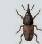
Charançon du riz Sitophilus oryzae