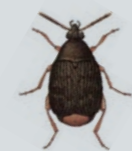
Bruche du haricot Acanthoscelides obtectus