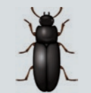
Tribolium roux Tribolium castaneum